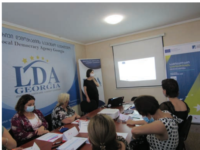
ტრენინგი, სამოქალაქო საზოგადოების ორგანიზაციებისთვის

პროექტის ფარგლებში ჩატარდა ტრენინგები CSO's/CBO's წარმომადგენელთათვის, რომელთა გადამზადებაც მოხდა პროექტის ფინანსური მენეჯმენტი/მართვისა და ადვოკატირების თემაზე. პროექტის ფარგლებში სულ ჩატარებულია ხუთი ტრენინგი, რომელზედაც გადამზადდა 50-მდე მონაწილე.