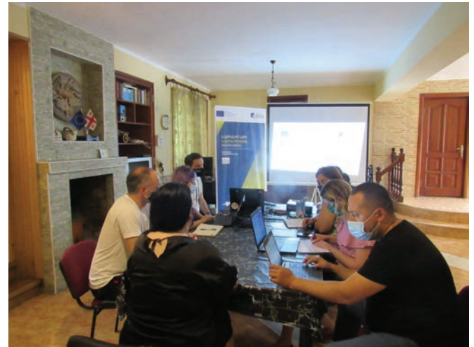
ქ.წყალტუბო - საკონსულტაციო შეხვედრა

გაათვისებინა სამოქალაქო საზოგადოების ორგანიზაციების პოზიტიური როლი საჯარო პოლიტიკაში, რისი ნათელი გამოხატულებაც გახლდათ მუნიციპალიტეტების აქტიური ჩართულობა რეგიონული ჰაბის ფარგლებში განხორციელებულ აქტივობებშიც.