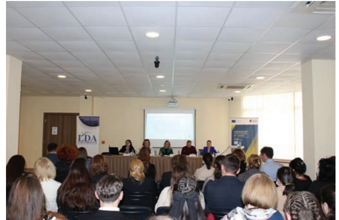
ქ. ამბროლაური - სასწავლო ვიზიტი

იმერეთის რეგიონულმა ჰაბმა პროექტის ფარგლებში ჩაატარა საჯარო შეხვედრა და გასცა საჯარო კონსულტაციები რეგიონის დონეზე. შეხვედრის მიზანს წარმოადგენდა რეგიონის დონეზე შესაბამისი აქტორების ჩართულობით განხილული მნიშვნელოვანი საკითხები. ჩატარებულ შეხვედრაზე გაიმართა მსჯელობა ადგილობრივი თვითმმართველობის დონეზე ახალგაზრდული პოლიტიკის განვითარების შესაძლებლობებსა და ამ მიმართულებით არსებულ გამოწვევებზე. შეხვედრამ ხელი შეუწყო სამოქალაქო საზოგადოების ჩართულობას საჯარო პოლიტიკის დიალოგში.